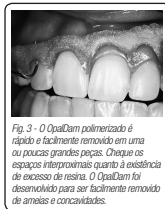
Fig. 3 - O OpalDam polimerizado é rápido e facilmente removido em uma ou poucas grandes peças. Cheque os espaços interproximais quanto à existência de excesso de resina. O OpalDam foi desenvolvido para ser facilmente removido de ameias e concavidades.

2. Remova o OpalDam dos espaços interproximais com um explorador e/ou fio dental (lave a região com um jato de ar / água).