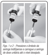
Figs. 1 e 2 - Pressione o êmbolo da seringa IndiSpense e carregue a seringa de dose unitária até o nível desejado.

4. No momento da utilização, prossiga com os passos 1 a 4 descritos na seção "procedimento".