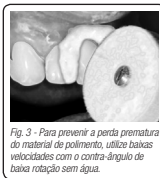
Fig. 3 - Pasta aplicada em uma pasta de polimento, utilize baixas velocidades com o contra-ângulo de baixa rotação sem água.