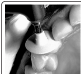
Fig. 1 - Utilize brocas carbide e/ou diamantadas finas, as pontas, discos e taças Jiffy e/ou tiras de acabamento para contorno e acabamento final da restauração.