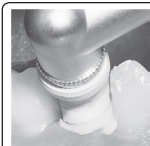
Fig. 5 - Desinfecte e limpe em apenas uma operação. Remova todo o cimento temporário, impurzas, etc. antes da cimentação final.