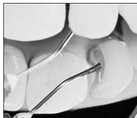
写真2： ブルーマイクロチップでのⅢ級 窩洞への塗布