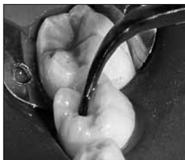
写真1： インスパイラルブラシチップでの 裂溝への塗布