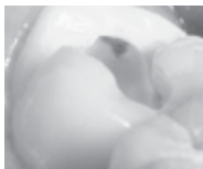
図1 見えにくい部位のう蝕を識別