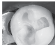
図4 検知液を再塗布・水洗して、う蝕が完全に除去されたことを確認してください。なお、う蝕象牙質深部には、ウルトラブレンドプラス]をごく少量塗布し、光重合させた後に修復材を使用します。