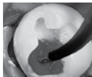
図2 ブラックミニブラシチップを使ってシークをう蝕象牙質に塗布。吸引しながらエア・ウォーターズプレーで水洗します。