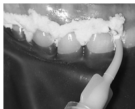
図1 ラバーダムを歯肉縁に装着する前に、まず少量のオパール®コーキングを歯肉縁および歯間空隙に塗布してください。

注記: オパールーストラおよび関連製品に関する詳細は、 www.ultradentjapan.com にアクセスしてください。