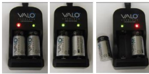
赤色のLEDライト点灯:充電中

ACアダプターを接続した充電器を電源に差し込み、陽極(+)側が充電器のLED側となるように電池を挿入する。充電完了には1～3時間を要する。充電が完了するまで電池を外さないようにする。