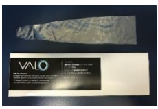
VALO コードレスバリアスリーブ (再使用禁止)