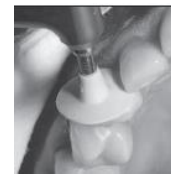
写真1 歯科用ゴム製研磨材(ディスク)による歯面研磨