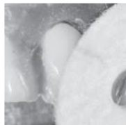
写真2 歯科予防治療用ブラシ(ゴートヘアブラシ)による歯面研磨